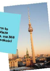
Berliner Fernsehturm to Berlińska Wieża Telewizyjna, ma 368 metrów wysokości