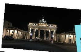
Brama Brandenburska była budowana w latach 1788-1791