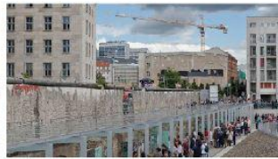
fragment Muru Berlińskiego