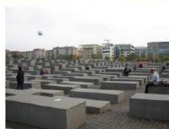
Pomnik Pomordowanych Żydów Europy