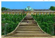
Poczdam- pałac Sanssouci