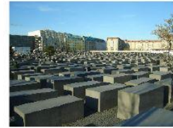
Pomnik Pomordowanych Żydów Europy