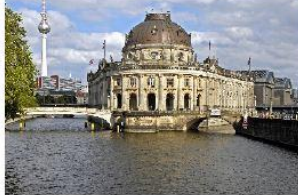
Muzeum Insel- Wyspa muzeów