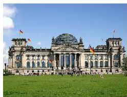
Gmach parlamentu Rzeszy w Berlinie