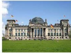
siedziba parlamentu: Reichstag