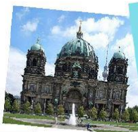
Wyspa Muzeów to jeden z najważniejszych kompleksów muzealnych świata