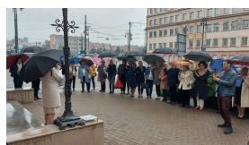
Zaproszeni goście oraz nauczyciele konsultanci