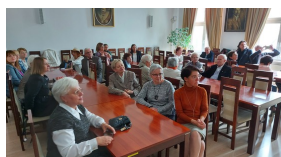
W gościnnych progach KPCEN