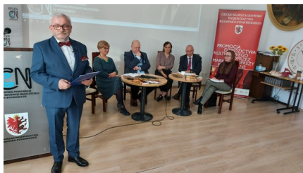
Prelegenci i prowadzący Konferencję, fot. Jan Szczepańczyk