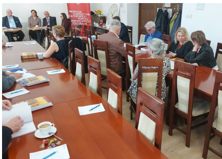
Uczestnicy Konferencji, fot. Jan Szczepańczyk