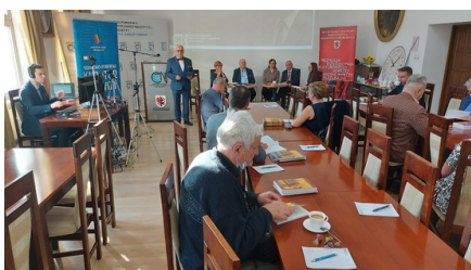
Przekaz hybrydowy Konferencji