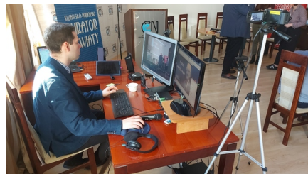
Obsługa Konferencji online, fot. Jan Szczepańczyk